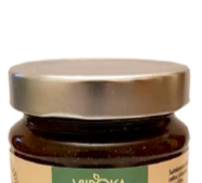
ŠALTALANKIŲ uogienė SEA BUCKTHORN preserve 320 g

Sea Buckthorn has long been used in traditional medicine to prevent aging and promote the health. The high abundance of antioxidants, vitamins, and flavonoids make sea buckthorn a great health product. To support your health you need a cup of tea, which could be prepared from our sea buckthorn puree. In a cup of hot or cold water just put two spoons (35 g) of puree. We offer you to taste puree and preserve with chili or ginger.