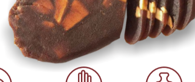
TRADICINIS obuolių sūris su pankoliu TRADITIONAL apple dessert with fennel 1 dėžutė. Galojimas 1 metai/1 year