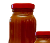
ŠALTALANKIŲ tyrė SEA BUCKTHORN puree for tea 750 ml, 320 ml