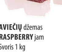
AVIEČIŲ džemas RASPBERRY jam Svoris 1 kg Galojimas 6 mėn. / 6 months