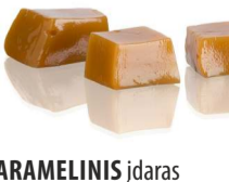
KARAMELINIS įdaras CARAMEL flavour filling Svoris 7 kg, 13 kg Galojimas 6 mėn. / 6 months

Fillings are products that are used for industrial processing, confectionery, production of pastries. They are termostable and their texture and flavour features remain unchanged under thermal regime.