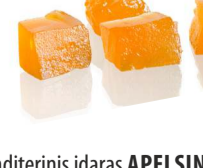
Konditerinis įdaras APELSINŲ skonio ORANGE flavour filling Svoris 7 kg Galojimas 6 mėn. / 6 months