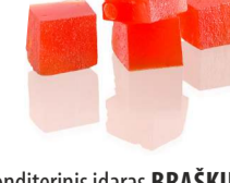
Konditerinis įdaras BRAŠKIŲ skonio STRAWBERRY flavour filling Svoris 7 kg Galojimas 6 mėn. / 6 months