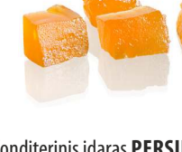
Konditerinis įdaras PERSIKŲ skonio PEACH flavour filling Svoris 7 kg Galojimas 6 mėn. / 6 months