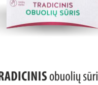
TRADICINIS obuolių sūris TRADITIONAL apple dessert 1 dėžutė. Galojimas 1 metai/1 year

Traditional apple dessert - an authentic hand made Lithuanian delicacy which recipe traces back to centuries ago. To make this dessert only selected apples from Lithuanian orchards are used. Our unique novelties are new traditional apple desserts with chili pepper, quince, hazelnuts - a perfect dessert to serve with a tea or coffee, as well as a tasty snack in office or school, or simply a great gift from Lithuania.