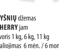
VYSNIŲ džemas CHEERRY jam Svoris 1 kg, 6 kg, 11 kg Galojimas 6 mėn. / 6 months