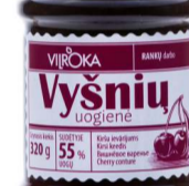
VYSNIŲ uogienė CHEERRY preserve Svoris 320 g / 600 g Kiekis 12 vnt./ 8 vnt. Galojimas 2 metai / 2 years.