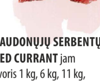
RAUDONŲJŲ serbentų džemas RED CURRANT jam Svoris 1 kg, 6 kg, 11 kg Galojimas 6 mėn. / 6 months