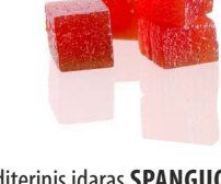
Konditerinis įdaras SPANGUOLIŲ skonio CRANBERRY flavour filling Svoris 7 kg Galojimas 6 mėn. / 6 months