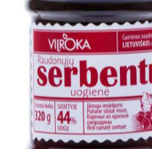
RAUDONŲJŲ serbentų uogienė RED CURRANT preserve Svoris 320 g / 600 g Kiekis 12 vnt./ 8 vnt. Galojimas 2 metai / 2 years.