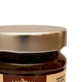
ŠALTALANKIŲ uogienė su imbieru SEA BUCKTHORN with ginger 320 g