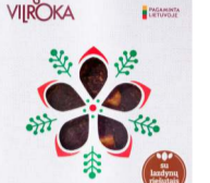
TRADICINIS obuolių sūris su lazdyno riešutais TRADITIONAL apple dessert with hazelnuts 1 dėžutė. Galojimas 1 metai/1 year