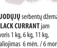
JUODŲJŲ serbentų džemas BLACK CURRANT jam Svoris 1 kg, 6 kg, 11 kg Galojimas 6 mėn. / 6 months