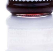
SPANGUOLIŲ uogienė CRANBERRY preserve Svoris 320 g / 600 g Kiekis dėžėje 12 vnt./ 8 vnt. Galojimas 2 metai / 2 years.