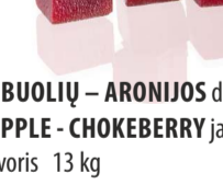
OBUOLIŲ – ARONIJOS džemas APPLE - CHOKEBERRY jam Svoris 13 kg Galojimas 6 mėn. / 6 months