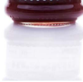
BRAŠKIŲ uogienė STRAWBERRY preserve Svoris 320 g / 600 g Kiekis dėžėje 12 vnt./ 8 vnt. Galojimas 2 metai / 2 years.

Preserves are made with whole or large pieces of high-quality fruit. Vilroka preserves do not contain any artificial preservatives, flavor or color. Preserve is an excellent and delicious accompaniment to pancakes, pastries or porridge, and in combination with yoghurt or ice cream.