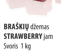
BRAŠKIŲ džemas STRAWBERRY jam Svoris 1 kg Galojimas 6 mėn. / 6 months