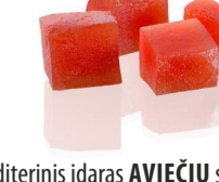
Konditerinis įdaras AVIEČIŲ skonio RASPBERRY flavour filling Svoris 7 kg Galojimas 6 mėn. / 6 months