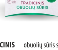
TRADICINIS obuolių sūris su pankoliu TRADITIONAL apple dessert with fennel 1 dėžutė. Galojimas 1 metai/1 year