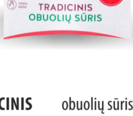
TRADICINIS obuolių sūris su čili TRADITIONAL apple dessert with chili 1 dėžutė. Galojimas 1 metai/1 year