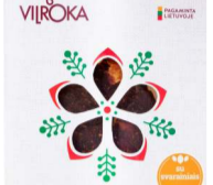
TRADICINIS obuolių sūris su svaraminiais TRADITIONAL apple dessert with quince 1 dėžutė. Galojimas 1 metai/1 year