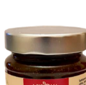
ŠALTALANKIŲ uogienė su čili SEA BUCKTHORN with chili preserve 320 g