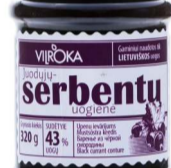
JUODŲJŲ serbentų uogienė BLACK CURRANT preserve Svoris 320 g / 600 g Kiekis 12 vnt./ 8 vnt. Galojimas 2 metai / 2 years.