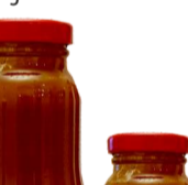
ŠALTALANKIŲ tyrė arbatai su imbieru SEA BUCKTHORN puree with ginger for tea 750 ml, 320 ml