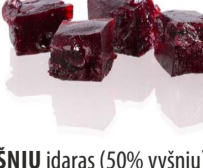
VYSNIŲ įdaras (50% vyšnių) CHEERRY filling (50% cherry) Svoris 10 kg Galojimas 6 mėn. / 6 months