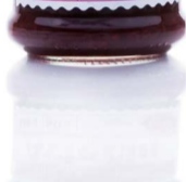
AVIEČIŲ uogienė RASPBERRY preserve Svoris 320 g / 600 g Kiekis dėžėje 12 vnt./ 8 vnt. Galojimas 2 metai / 2 years.