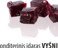
Konditerinis įdaras VYSNIŲ skonio CHEERRY flavour filling Svoris 7 kg Galojimas 6 mėn. / 6 months